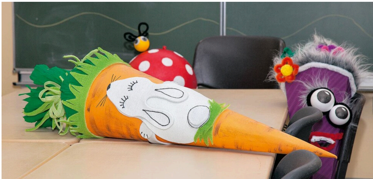
Školní kornout pro zápis do školy "Zajíček a mrkev"