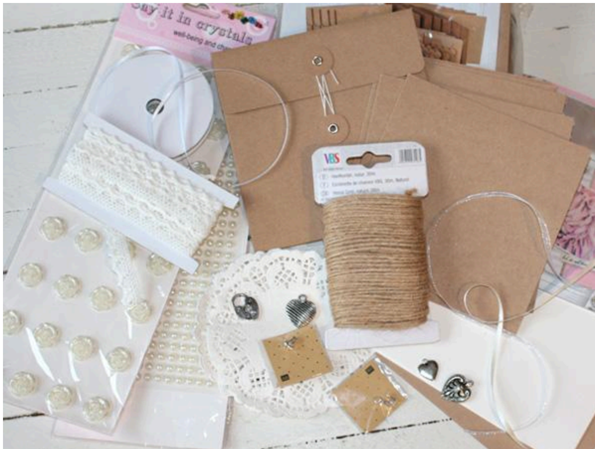
Krok 1: Navrhňte