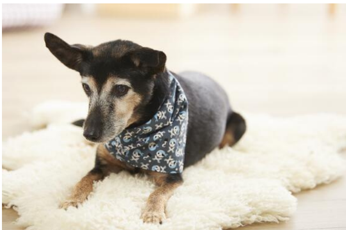
Šála pro psy.

Hledáte další návody na šití pro své domácí mazlíčky? Co třeba šátek pro vašeho psa nebo myši na hraní pro vaši kočku? Oba návody na šití jsou velmi snadné na ušití a jsou vhodné i pro začátečníky.