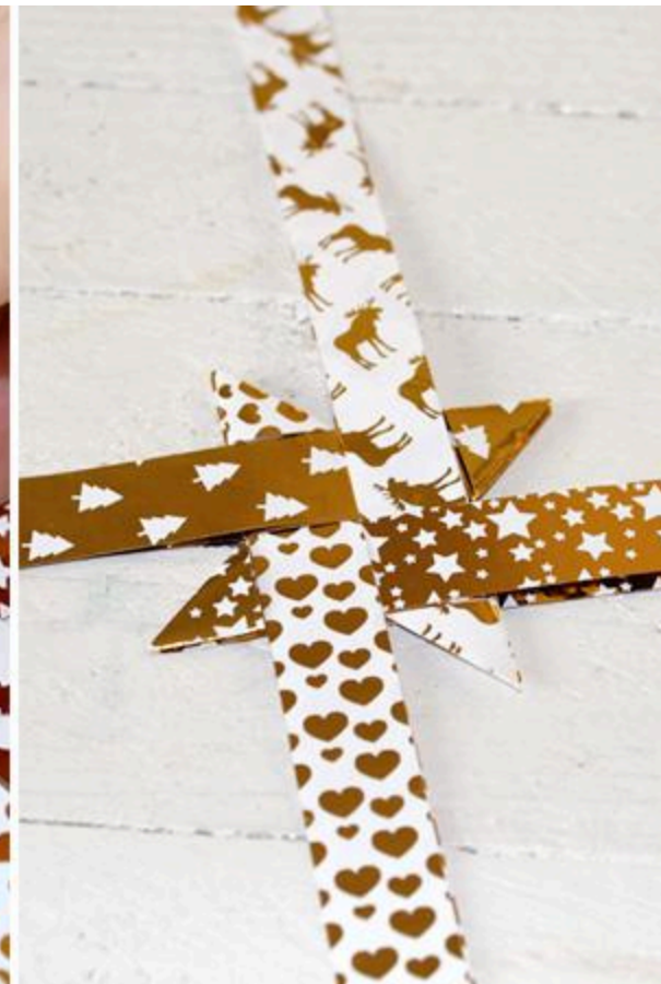
Krok 3: Vytvarujte trojrozměrné body