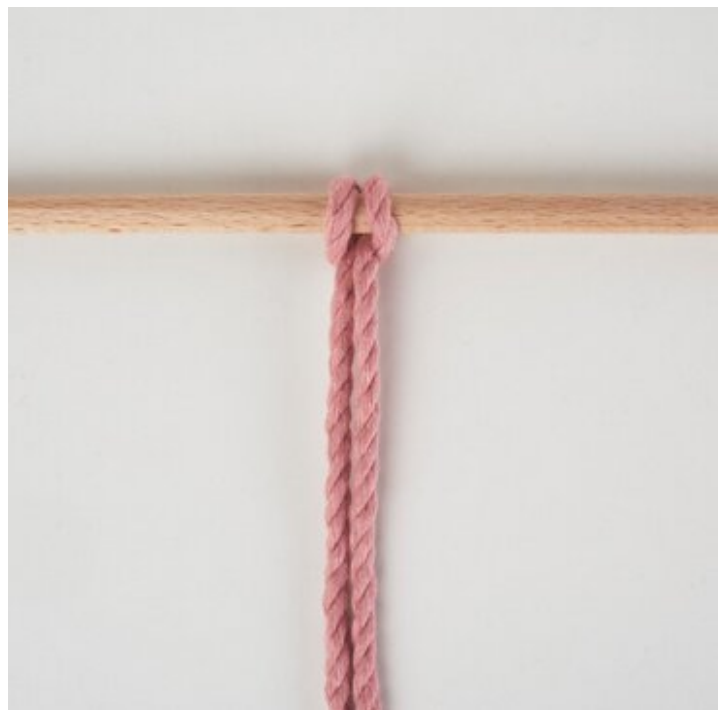
Skřiváncí uzel na hlavě dopředu

Jednoduše si je vytiskněte a použijte jako šablonu.